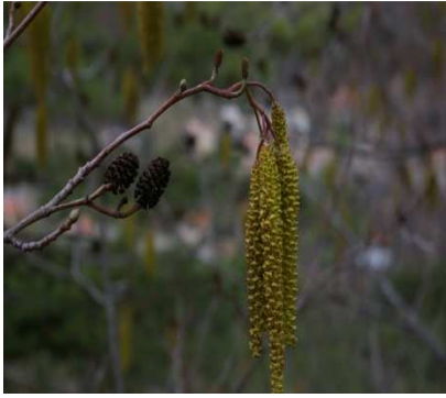
Strobiles et chatons de l'Aulne

Accès routier : Depuis Sisteron prendre la D951 en direction de la Motte-du-Caire. Poursuivez la départementale sur 4km pour arriver sur la place du village du Caire, point de départ de votre randonnée.