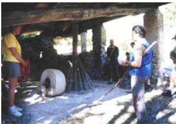
Moulin à gypse

Prendre la D951 en direction de Turriers. Bifurquer à droite 200m plus loin pour emprunter un sentier qui surplombe la vallée du Grand Vallon. Une heure trente plus tard, vous atteignez le plateau du grand Abian avec les ruines d'une grande ferme encore en activité au début du XX e siècle. Se diriger plein sud par la piste qui longe le rocher roux. Peu après, quitter cette piste sur votre gauche par un sentier en sous bois qui vous guidera jusqu'au moulin à plâtre de la Gypière.