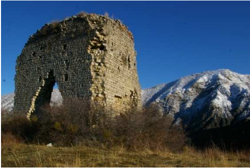
Tour de Melve (XIII e siècle)

Après s'être garé sur la place du village avec sa fontaine, se diriger plein nord sur une belle piste puis sentier jusqu'à la tour carrée qui domine le village. Peu avant celle-ci, le sentier bifurque à droite à travers pâturage puis petite pinède. Peu de temps après, la traversée d'une zone marneuse à franchir sur sa crête peut s'avérer impressionnante pour toute personne sujette au vertige. Prudence de rigueur. Le sentier poursuit son chemin après être passé sur les hauteurs de la Motte du Caire et son vallon depuis la ferme du Saignon jusqu'à la crête de « la montagne ». Prendre sur sa gauche pour atteindre en peu de temps le sommet des Croix. Poursuivre sur cette arête jusqu'aux abords de la tête de Boursier et la liaison avec le circuit N° 13. La descente plein sud vers la D104 et Melve se fera sans difficulté particulière.