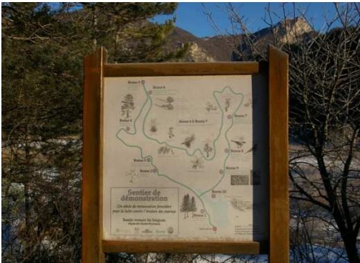
Départ du sentier de démonstration

10 bornes jalonnent ce circuit en ayant pour thème principal, « la restauration forestière durant un siècle afin de lutter contre l'érosion de marnes » ( document pédagogique réalisé par le CEMAGREF et l'ONF à disposition à l'office de tourisme ). De la place du village, remonter le ravin de Saignon jusqu'au barrage du même nom. Poursuivre cette piste en direction du sommet des Croix. La jonction avec une nouvelle piste vous oblige à laisser sur votre gauche celle conduisant à la ferme du Saignon. De ce fait, et après avoir franchi les bornes 5 et 6, revenir sur la piste de droite pour l'emprunter sur plus d'un km. Un sentier à droite va vous conduire jusqu'à la retenue du Saignon que vous traversez afin de rejoindre la première partie de votre circuit. Le retour à la Motte du Caire va se faire par la même piste d'accès au barrage.