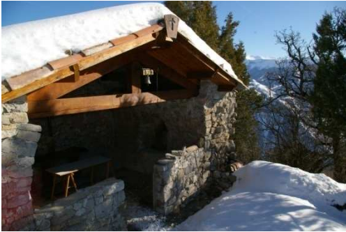
Chapelle St Amand sous la neige

Au départ de Clamensane et de son cimetière, grimper sur le haut du village. Un joli sentier vous guide jusqu'à la route des Graves que vous empruntez sur 500m avant de bifurquer à droite sur une large piste. Durant presque 2h, celle-ci va vous guider jusqu'au col de la Croix. Un sentier prend enfin le relais pour vous amener, après être passé à travers un bel éboulis, au pied de la chapelle et sur sa terrasse qui domine la vallée de la Sasse. Jusque dans les années 1920, une procession partie de toute la vallée aboutissait ici le lendemain de la Pentecôte. La descente, plus directe vers Clamensane serpente dans une chênaie jusqu'au ravin des Naïsses et ses bassins à chanvre. Enfin, la D1 vous ramène à votre point de départ, sans oublier si la soif se fait sentir, la buvette du camping du clos du Jay.