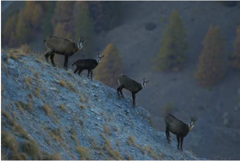
CHAMOIS EN FAMILLE

Depuis la place du village, redescendre légèrement la départementale puis s'engager à gauche sur une belle piste qui permet la liaison entre la vallée de la Sasse et celle du Vanson. Après avoir traversé à gué le ravin d'Entraix et son impressionnante cascade, remonter par cette piste jusqu'à la première boucle à gauche. Quelques mètres plus loin, quitter cette piste en vous engageant sur un joli sentier bien marqué par le passage répété de quelques bovins. Sur le haut de ce sentier, failles et hêtres centenaires vous encadrent. Vous atteignez enfin le mélézin, que vous traversez par pistes et sentiers pour atteindre les pâturages du Trainon. Les traverser d'ouest en est, puis redescendre vers la ferme de Théous et sa piste qui vous ramène vers Valavoire.