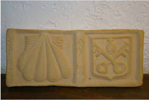
Création réalisée par un pèlerin des amis de St Jacques

Après vous être garé dans Nibles, rejoindre la D 951 que vous empruntez sur 200m environ en direction de Sisteron. Depuis Nibles, le balisage rouge et blanc du GR 653D va vous guider durant la moitié de ce circuit. Quitter la départementale à droite par un petit sentier jusqu'aux fermes de Clans et Borelly. De là, prendre plein Nord une piste qui va vous guider jusqu'au passage de l'homme mort. Laisser sur votre gauche le balisage du circuit de St Jacques puis poursuivre sur cette piste et son balisage jaune durant un peu plus d'une heure. Soyez attentif à un croisement de pistes au sentier qui plonge sur votre droite en direction de la vallée de la Sasse. Vous atteignez enfin la D 951 que vous traversez avec attention. Il ne vous reste plus qu'à rejoindre Nibles par la rive gauche de son canal d'arrosage.