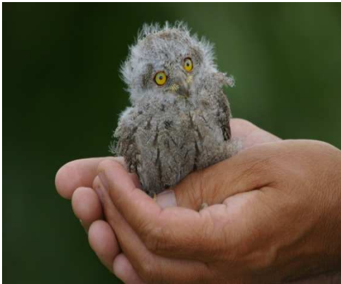
Petit duc immature

Se garer sur la place située à l'entrée de Châteaufort. Pour ne pas avoir à surcharger en balisage toute la première partie du circuit, on suit le tracé rouge et blanc du tout récent GR 653D qui permet la liaison de St Jacques de Compostelle à Rome.