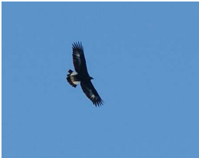
JEUNE AIGLE ROYAL

Après être arrivé à hauteur d'Esparron, poursuivez votre route sur la piste d'accès au lac. De juin à fin août, celle-ci est ouverte jusqu'à proximité du lac. En dehors de cette période, une barrière réduit votre accès en voiture de 3 km. Votre randonnée peut enfin commencer. Rejoignez le lac soit par la piste soit par un joli sentier. Du lac, poursuivre son chemin en suivant la piste qui le longe sur sa gauche jusqu'à la prochaine bifurcation, 1km plus loin. Prendre à droite en délaissant le GR6 sur votre gauche. Dès lors un sentier chemine à travers une belle forêt d'épicéas puis de mélèzes jusqu'à l'aplomb des pâturages et de la cabane de Clapouse. Poursuivre ce sentier jusqu'à la crête du Raus, point de vue dominant sur la vallée de Reynier au Nord-Ouest et du cirque de Coste Belle à l'Ouest. A partir de là, plus de sentier jusqu'aux pâturages de Clapouse en passant par le sommet des Monges (2115m). PRUDENCE de rigueur. Après avoir atteint la crête sommitale et son point de vue sur Clapouse, la longer sur plus d'1km puis redescendre plein Nord vers le col de Clapouse. Dès lors, le GR6, après la traversée des pâturages parsemés de blocs rocheux « oubliés » il y a quelques dizaines de milliers d'années par un glacier, vous ramène vers le lac des Monges et son parking.