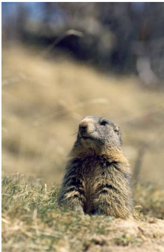
MARMOTTE aux aguets

Après être arrivé à hauteur d'Esparron, poursuivez votre route sur la piste d'accès au lac. 3 km plus loin, garez-vous aux abords d'un petit gué alimenté par les sources de la Garnaysse.